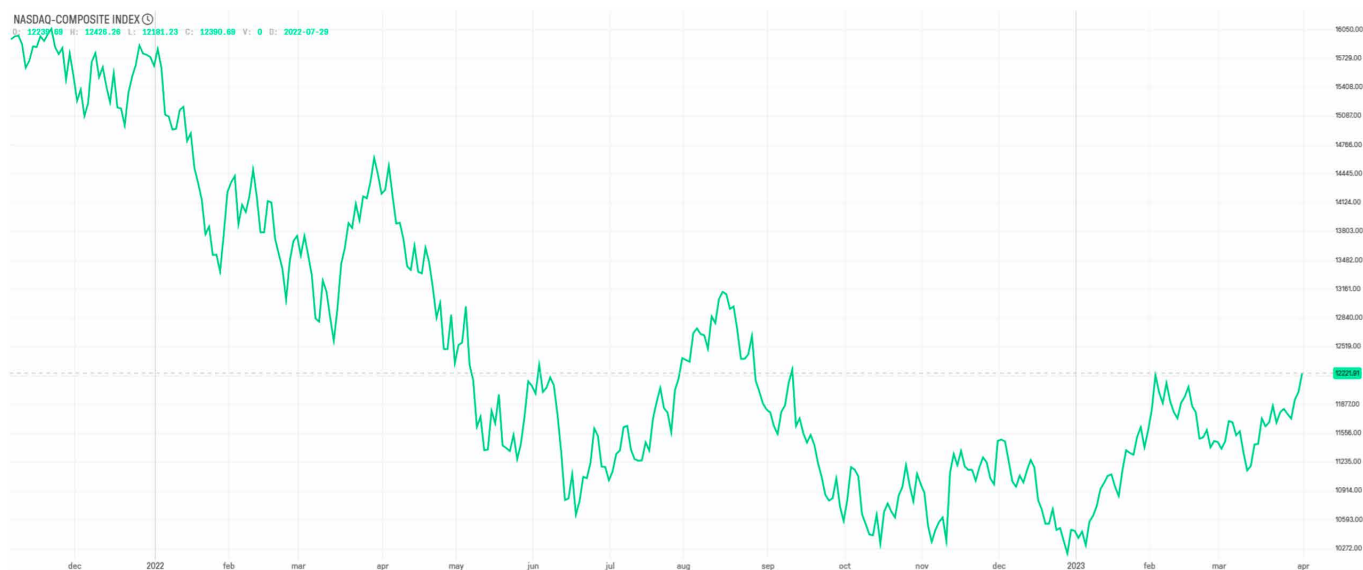
Grafiek Nasdaq Composite

Er was een duidelijke rotatie zichtbaar van waarde- naar groeiaandelen: de Dow Jones index, die veel value-aandelen bevat, bleef met een stijging van 0,4% flink achter op de andere Amerikaanse indices.